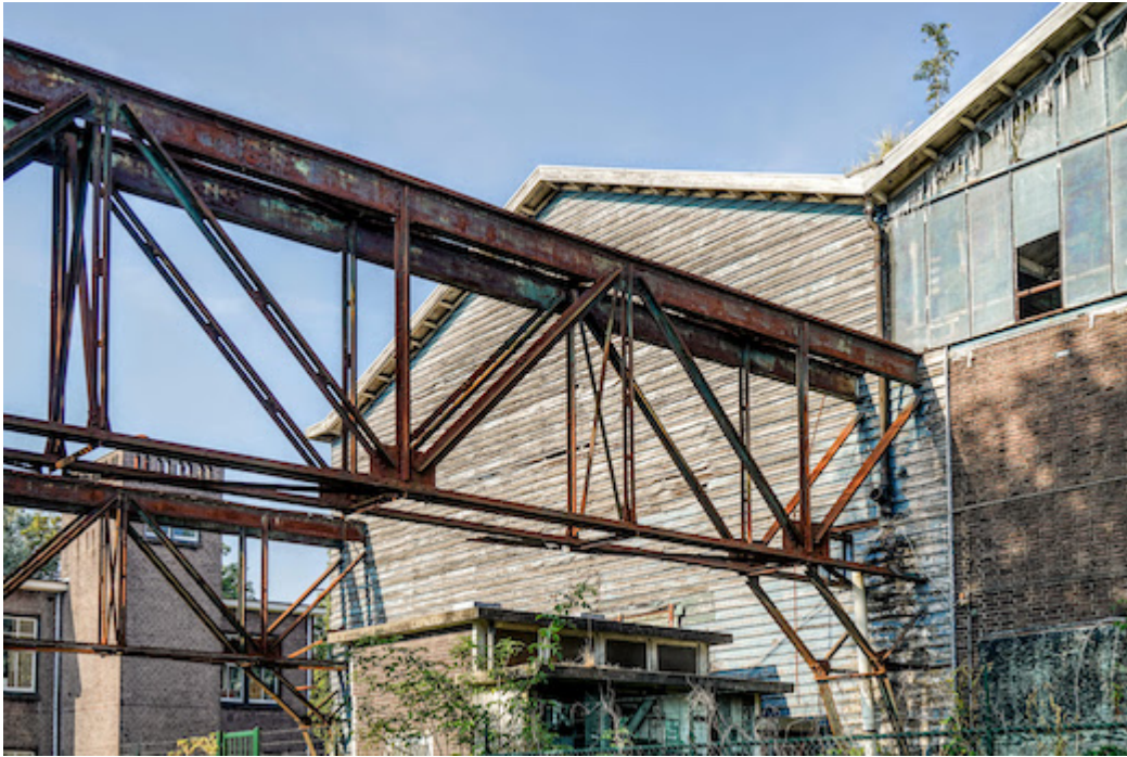
Parkeerhuis Gebouw 320