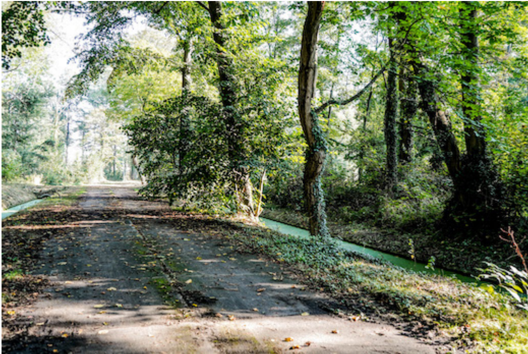
Noordelijk deel Hembrugterrein