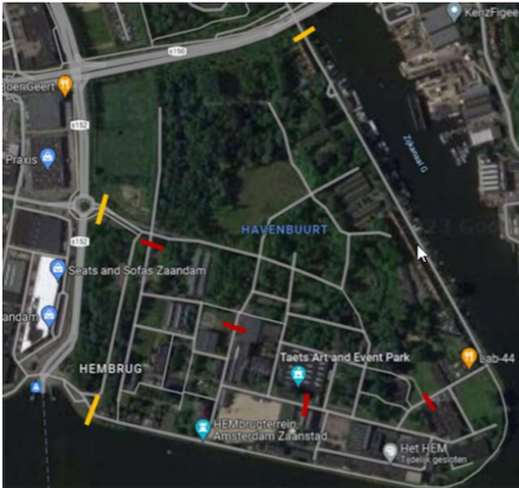
Overzicht telslangen op en net buiten het Hembrugterrein