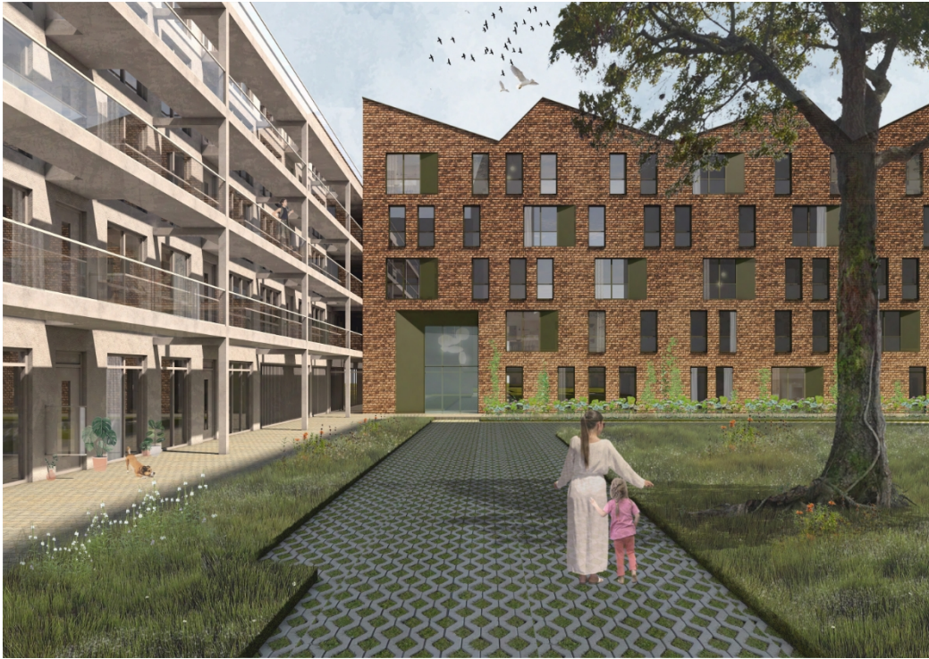
Schets nieuwbouw Blok 1A en Blok 1B Moke Architecten (noordwesthoek Hembrug)